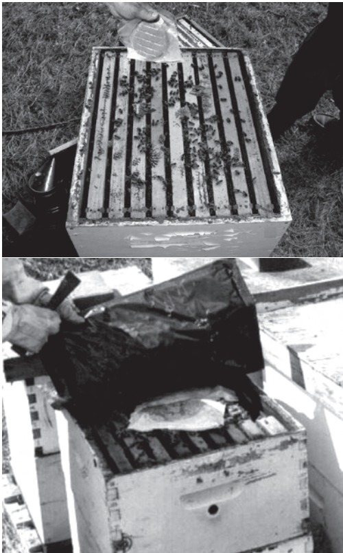
図1 パラフィン紙に包まれたペースト状の Feedbee® (上) と, 実際に巣箱上部に置かれた状態. パラフィン紙に包まれた状態で給餌した.

本研究の目的は, Feedbee® のミツバチに対する花粉代用飼料としての効果を野外実験によって明らかにすることにある. 具体的には, 摂食量で示される嗜好性と, 蜂児生産, 蜂量, ハチミツ生産などの蜂群の生物学的効果を, Feedbee® を与えた場合やミツバチが採集した花粉を与えた場合, さらに Mann Lake Ltd 社 (Hack-